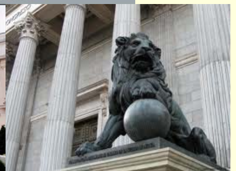
Fachada del Congreso de los Diputados