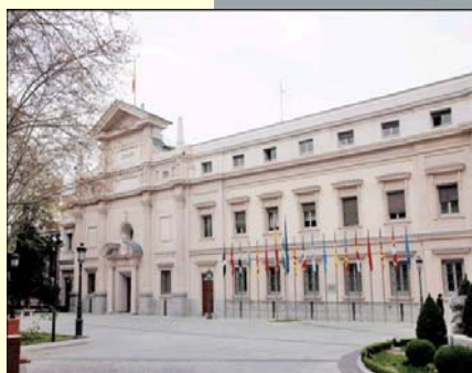
Fachada del Senado